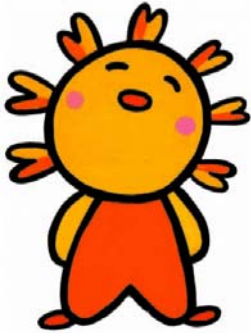
社協イメージキャラクター ソシア