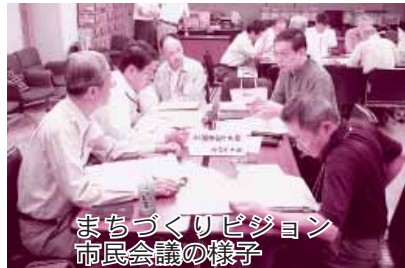
まちづくりビジョン 市民会議の様子

キーワードは市民、議会、行政が手を取り合い、密接に連携する「みんなの総合計画」。そのため、策定は市民の皆さんとの協働で進めています。