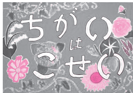
昨年の入選作品(大宮小学校児童作品)