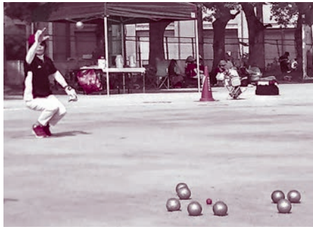
ペタンクの競技中の様子

ペタンクは、目標球（ビュット）に金属製のボールを投げ合せて、相手のボールより近づけることで得点を競うスポーツです。子どもから高齢者まで楽しめますので、ぜひ家族で参加してください。日時／5月20日(日)午前8時20分(荒天中止) 場所／春木運動広場(八幡町) 費用／1チーム(2人) 2千円 定員／64チーム(申込先着順) 申込・問合せ／4月2日(月)〜26日(木)に、申込用紙(市ホームページからダウンロード可)に