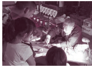
ミニだんじり製作実演

時間 午前10時〜11時半、午後1時半〜3時半 費用 大人600円、小・中学生300円(入場料)