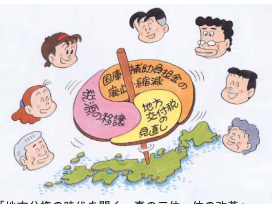
「地方分権の時代を開く 真の三位一体の改革」パンフレットより (まんが 田代しんたろう)

【答】影響額として、16年度で11億3千万円程度の減収、17年度は「安定的な財政運営に必要な一般財源の総額を確保する」との地方財政対策のため、5億5千万円程度の増収を見込んでいます。そのため、市民の役割分担の明確化をさらに進める必要性や、民間活力導入の検討を積極的に進めることも重要な取り組みと考えています。