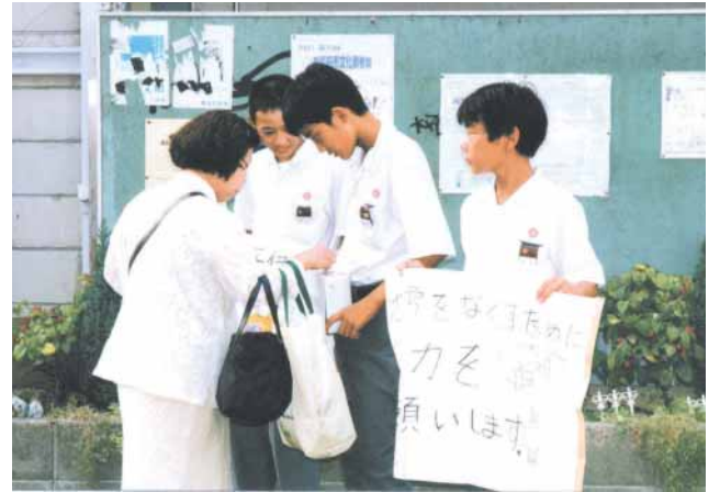
ボランティア活動を通じての道徳教育

【答】道徳はみずから見つけ、みずから問いかけることからは出発する。みずからの課題に取り組むには、道徳的価値に照らして自分自身を振り返ることが必要である。さまざまな教育活動のなかで、他