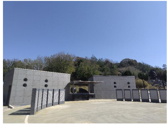
【写真2】 合葬式墓地 (R6 より供用)