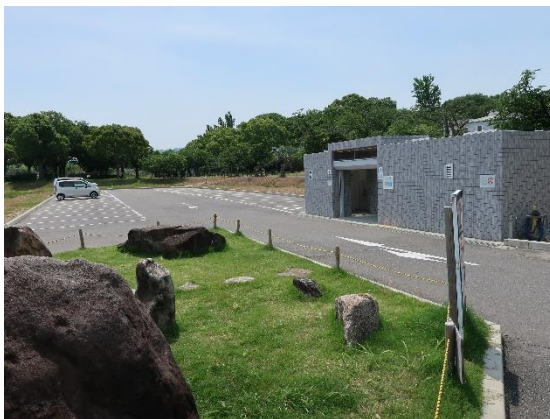
【写真3】 駐車場及びトイレ (第1墓苑)