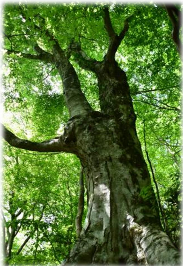
和泉葛城山の新緑