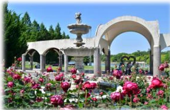
蜻蛉池公園のバラ