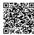
いきいき百歳体操動画