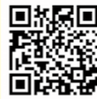
かみかみ百歳体操動画