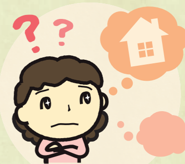
リフォームしたい方