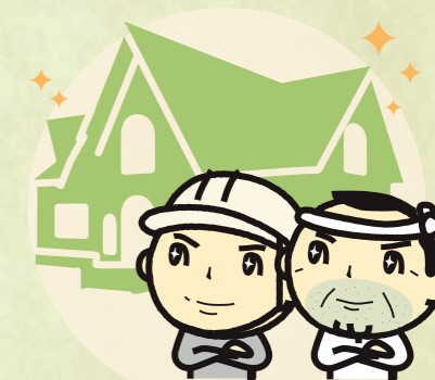
マイスター事業者