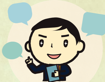
マイスター登録団体