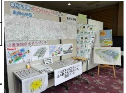
山直市民センターでの展示

基本計画では、地域の皆様の声をもとにした基本コンセプトを作成し、その実現のために市の計画と関連づけた基本構想等が盛り込まれています。