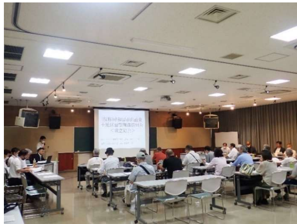
↑ ↓ 総会の様子

2023（令和5）年7月16日午後、山直市民センターにて、「 （仮称）岸和田市山直東土地区画整理準備組合設立総会 」が、予定施行区域の全地権者数55名に対し、出席者数47名（総会への本人出席が17名と、本人の委任状による代理出席及び書面での議決権行使書による出席者30名）により、 開催されました。