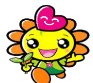
アカルイーネちゃん