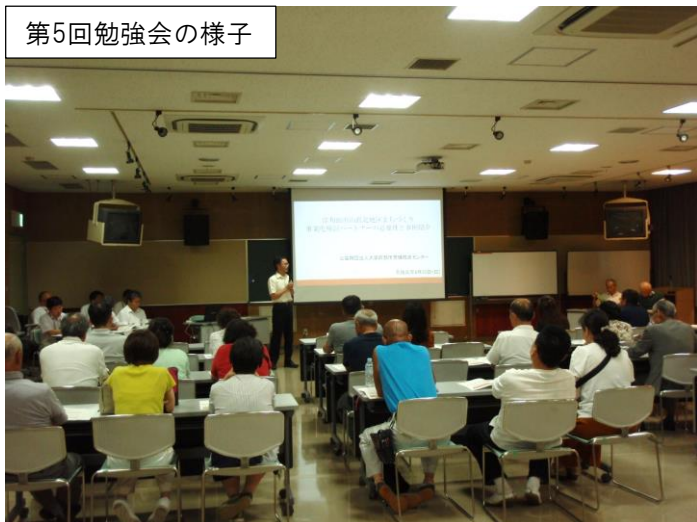
第5回勉強会の様子

アンケート調査結果からは、これまでの4回の勉強会で、まちづくりについて一定のご理解は進んでいるものの、将来どうなるのかという思いをお持ちの方が多数ということがわかりました。そういったことから、これからは、これまでの一般的な話から、山直北地区としての具体的な内容について検討していく、ということについてご説明しました。