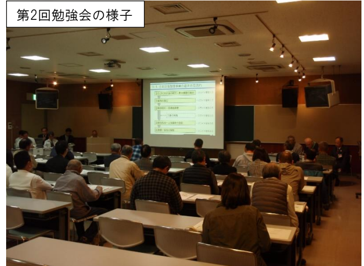
第2回勉強会の様子

また、補足として、現在事業中である『岸和田丘陵地区』の取組状況について事務局より説明しました。なお、当日の主なご質問、ご意見は次のとおりです。